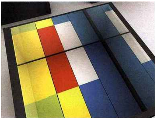
La nouvelle collection de carrelage Démesure par Christian Blecher

Le groupe italien Marrazzi a choisi Christian Blecher pour dessiner la nouvelle marque de céramiques "Démesure". Démesure comme démesuré, c'est le principe de la collection qui associe des carreaux de 60 x 60 cm à des mosaïques de 2 x 2 cm et à des joints en couleur dans une association cohérente de matières et de couleurs. Démesuré comme les partis-pris architecturaux de Christian Blecher reconnu pour ses choix osés et résolument contemporains comme le nouvel aménagement de la boutique et du restaurant-salon de thé Fauchon de la place de la Madeleine. Démesure y assurait le lancement de sa collection dans un univers de gris et de rose primaire, le premier décliné par la marque avant la révolution du fuchsia engagée sur les packagings par Desgrippes.