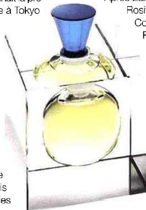
Le flacon de "L'Eau d'Issey" par Shiro Kuramata