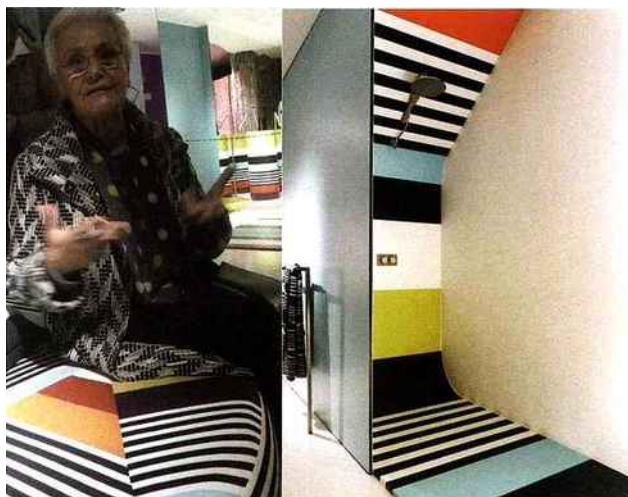
Rosita Missoni et l'espace salle de bains du off de Du Pont de Nemours pendant le Salon du Meuble de Milan

Après Zaha Hadid et Jean Nouvel, c'est Rosita Missoni qui a été choisie par Corian® pour réaliser l'espace Du Pont de Nemours qui défraye la chronique depuis quelques années dans les off du Salon du Meuble de Milan. La rencontre entre le maître de la couleur Rosita Missoni et le maître de la matière a donné lieu à un intérieur coloré aux associations chromatiques uniques. Réalisé sous la direction artistique de Rosita Missoni et supervisé par son fils Luca, le projet "Corian® loves Missoni" était marqué dès l'entrée par une pelote multicolore qui marquait l'enracinement de la marque dans la mode. "La maison est devenue mode, alors je me suis occupée de la maison" expliquait Rosita Missoni. "Ici, j'ai simplement copié les couleurs du Corian® pour faire un univers vibrant avec un coin repas encadré par deux grandes colonnes rectangulaires en Corian®, un espace salle de bains avec un paravent incurvé imprimé des motifs Missoni, un radiateur innovant qui exploite les qualités conductrices du matériau, un tapis en mosaïque de Corian®... Une optimisation et valorisation du matériau parce qu'il faut "construire la maison autour de la tête."